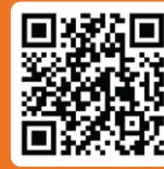
ดาวน์โหลดแอป

ยื่นเคลมหรือจัดการกรมธรรม์ออนไลน์ให้ชีวิตคุณง่ายขึ้นทุกด้าน